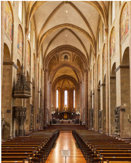
Das Hauptschiff des Mainzer Doms in Richtung Westen

Im Anschluss daran stärken wir uns mit einem Mittagessen in einem Brauhaus am Rand der Altstadt (Fußweg vom Dom aus ca. 15 Min.). Dort haben wir auch Gelegenheit zum Austausch und zu Gesprächen.