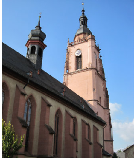
St. Peter und Paul in Eltville