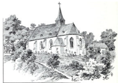
Wallfahrtskirche Wirzenborn um 1914 © Ferdinand Luthmer

Weitere Informationen folgen im Mai-Pfarrbrief.