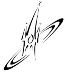
St. Johannes der Täufer Elz

Die Einladung gilt allen, die gern in Gemeinschaft essen wollen.