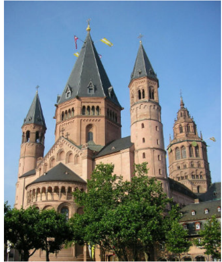
Nord-Ostfassade des Mainzer Doms, mit Liebfrauenplatz